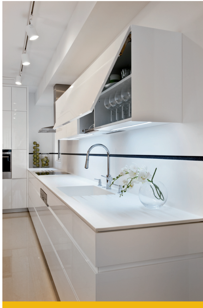
תאורה מוקפדת שולבה במטבח