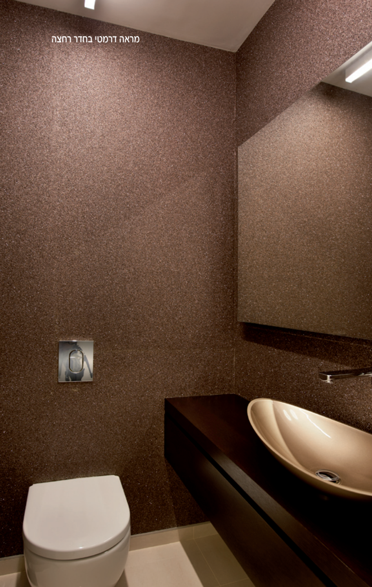
מראה דרמטי בחדר רחצה