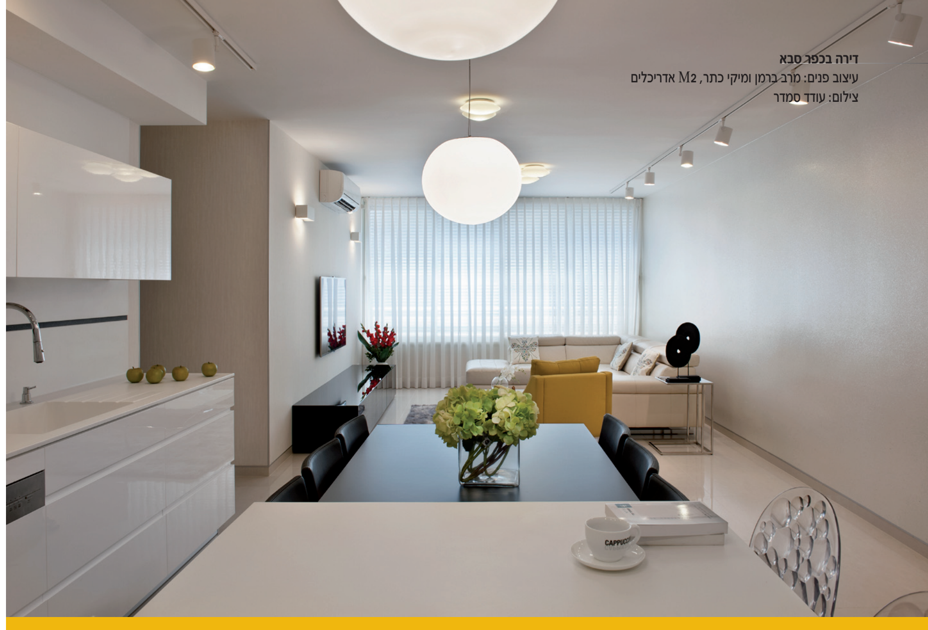
דירה בכפר סבא עיצוב פנים: מרב ברמן ומיקי כתר, M2 אדריכלים