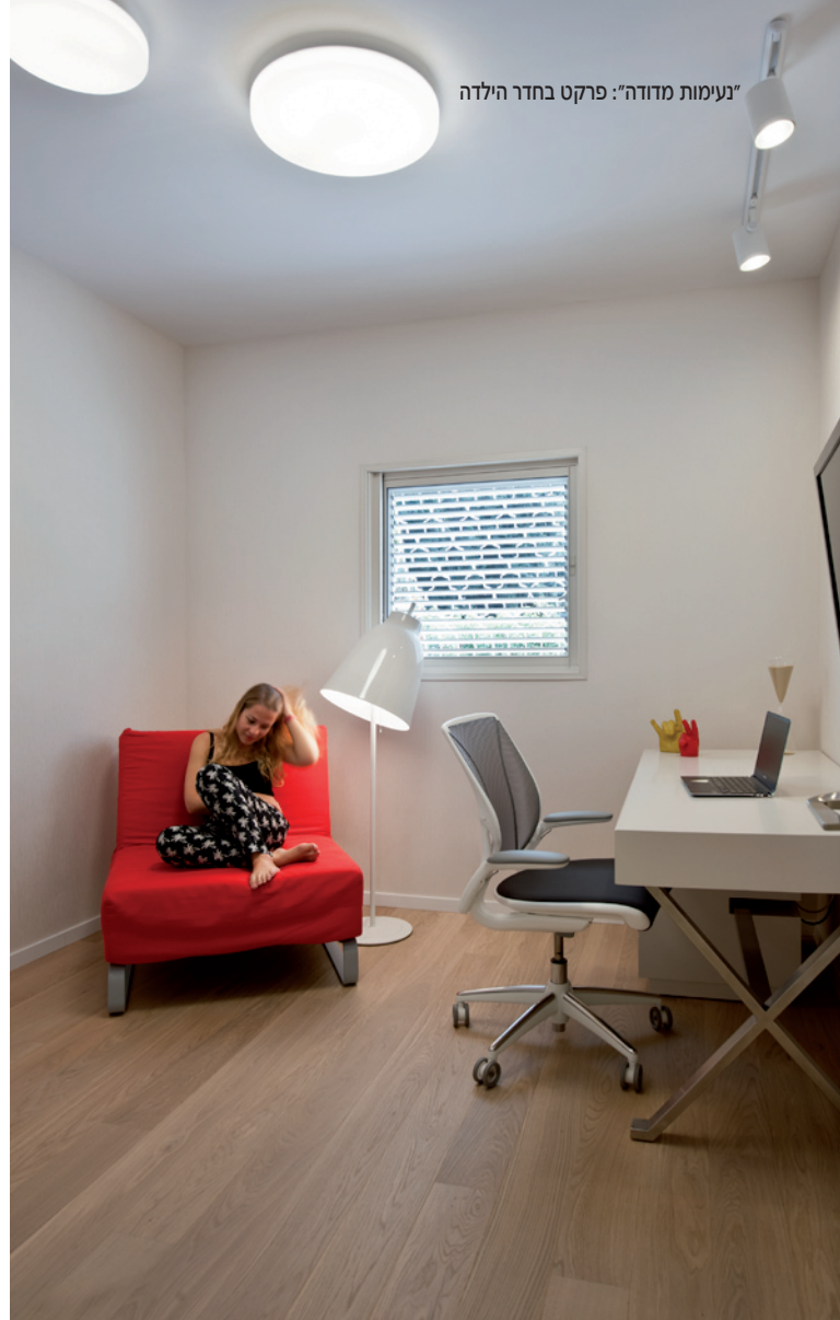
"נעימות מדודה": פרקט בחדר הילדה