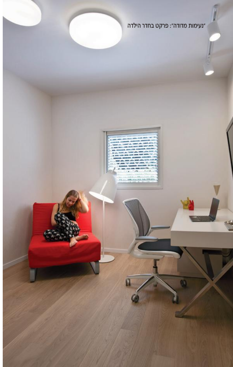
"נעימות מדודה": פרקט בחדר הילדה