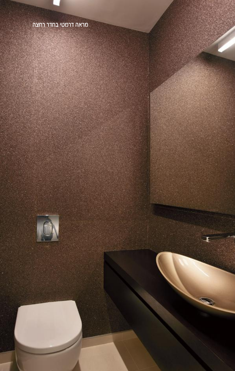
מראה דרמטי בחדר רחצה